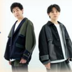
みんなで 手話ダンス♪