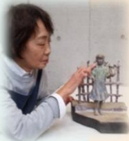
彫刻家 栗山賀行先生の 作品