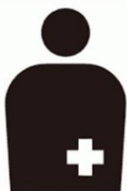
オストメイトマーク