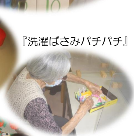
『洗濯ばさみパチパチ』