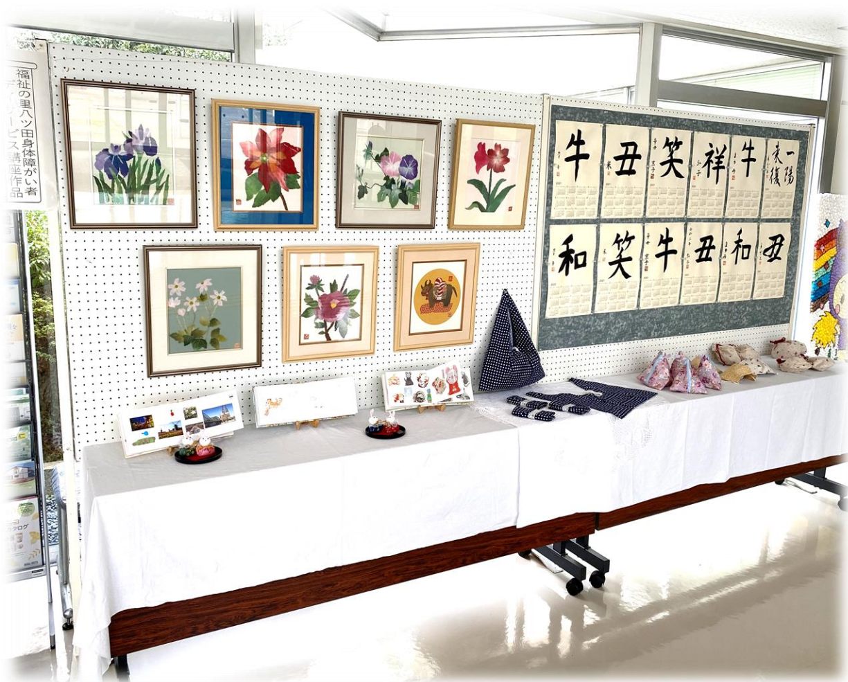
1階ロビーにて展示中の作品