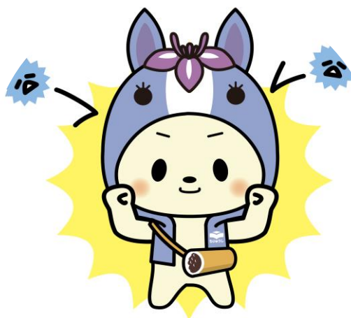
田中孝雄さんの作品