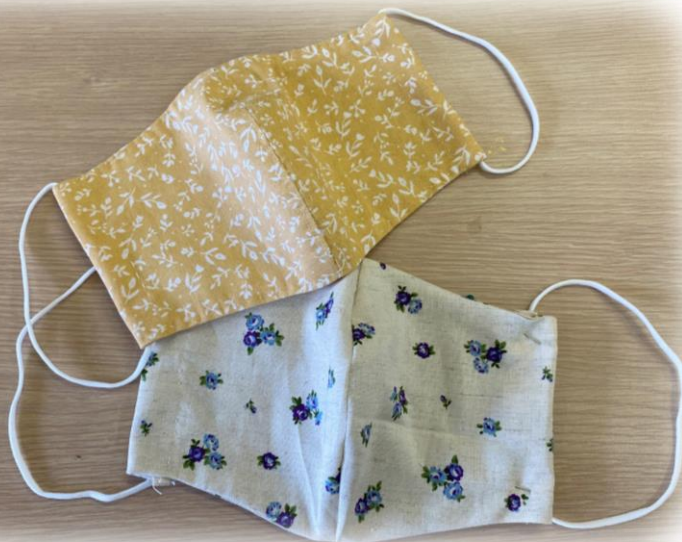
布の小物作り講座で作った手作りマスク

マスクをしていると、口の渇きに気付きにくいので、講座中もこまめな水分補給をお願いします。