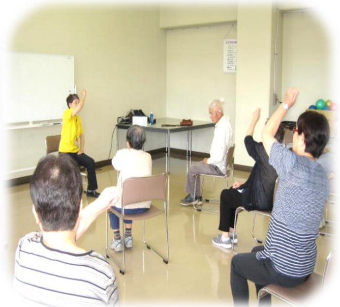
↑ 健康体操 練習風景