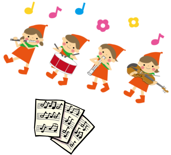
↑ オカリナ講座 練習風景