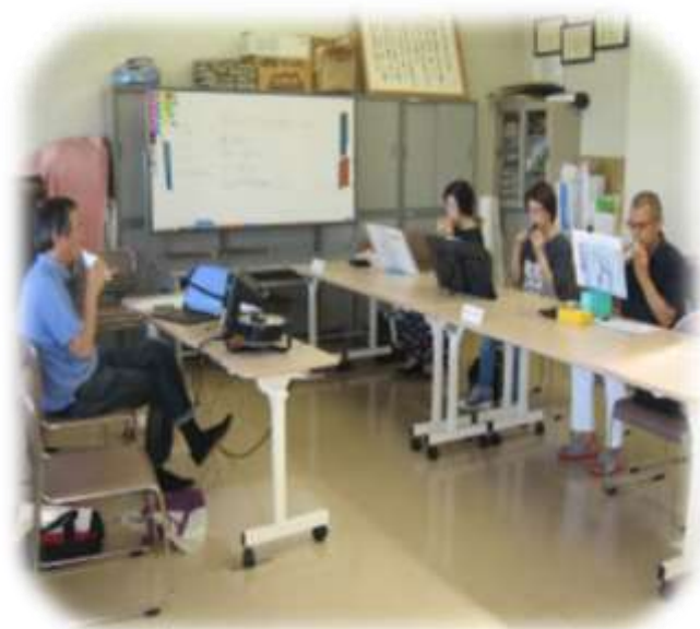
↑ オカリナ講座 練習風景