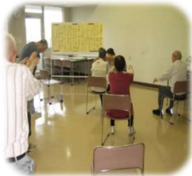
↑ 健康体操 練習風景