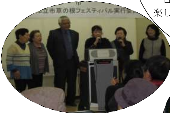
実行委員の皆さんで、『人生いろいろ』を熱唱されました。