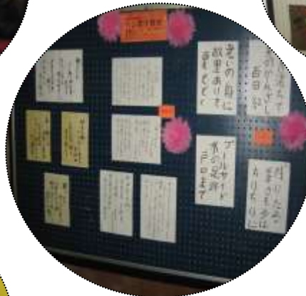
↑ペン習字や、布の手作り作品も展示されていました。