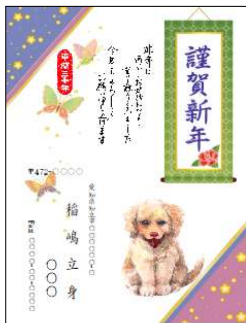
パソコン講座で作った年賀状