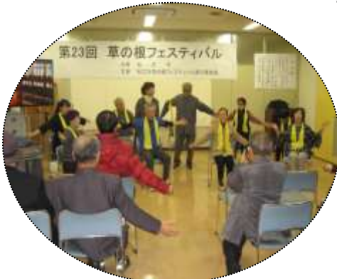
←健康体操です。観客の皆さんも一緒に体操しました。