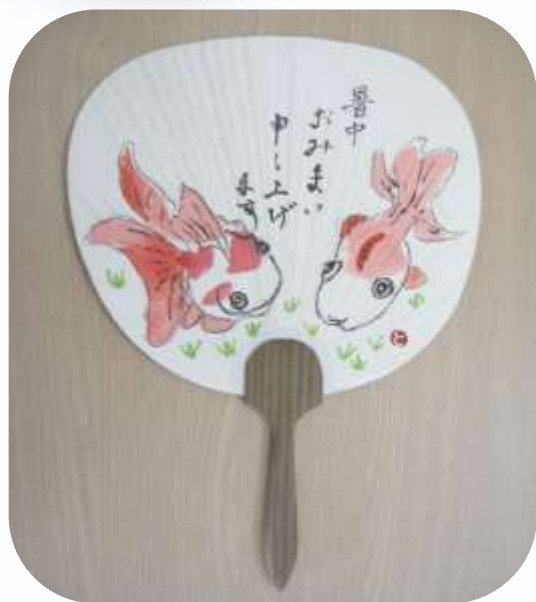
左右田とうさんの作品