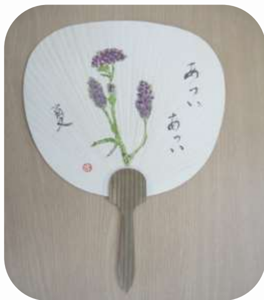
松本 澄子さんの作品