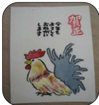
↑ 絵てがみ講座 ↑