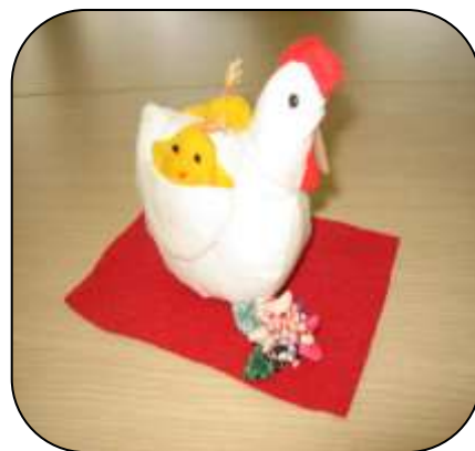
パッチワーク講座