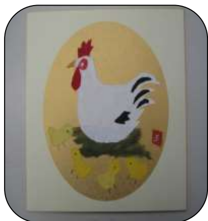
↑ ちぎり絵講座 ↑

今年もあと1ヶ月となりました。各講座で、来年の準備に励んでいますので、ご紹介します。